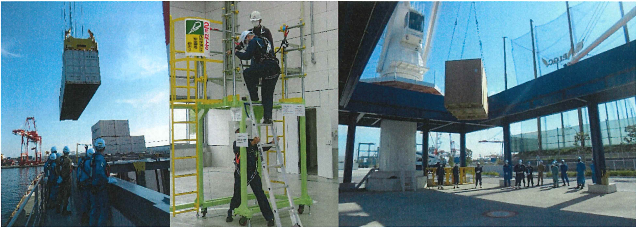
ガントリークレーン荷役作業 に潜む危険体感