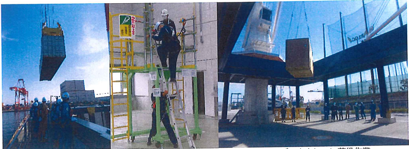
ガントリークレーン荷役作業 に潜む危険体感